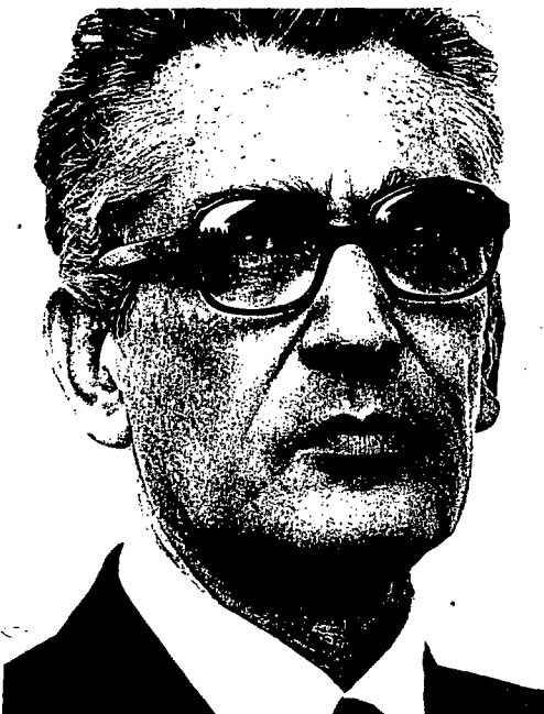
Juan Antonio Coderch

Se crea un foro para el debate arquitectónico